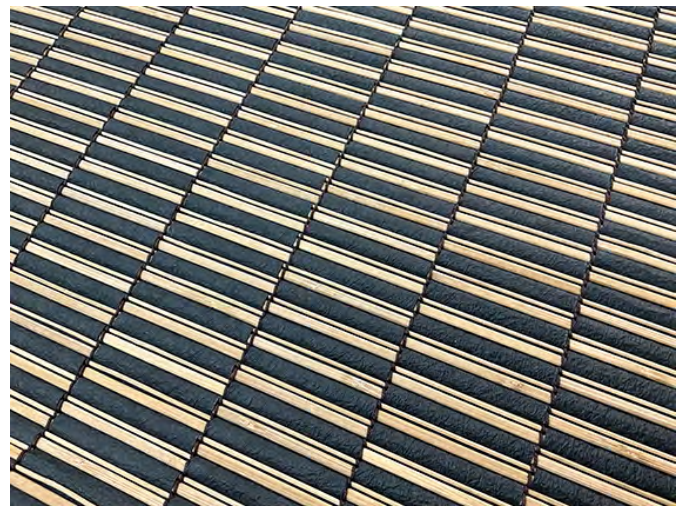
オーダー仕様 波襜すだれ 間に黒谷和紙（黒）こんにやく加工あり を通しています お客様のご依頼で、和紙を加工しました