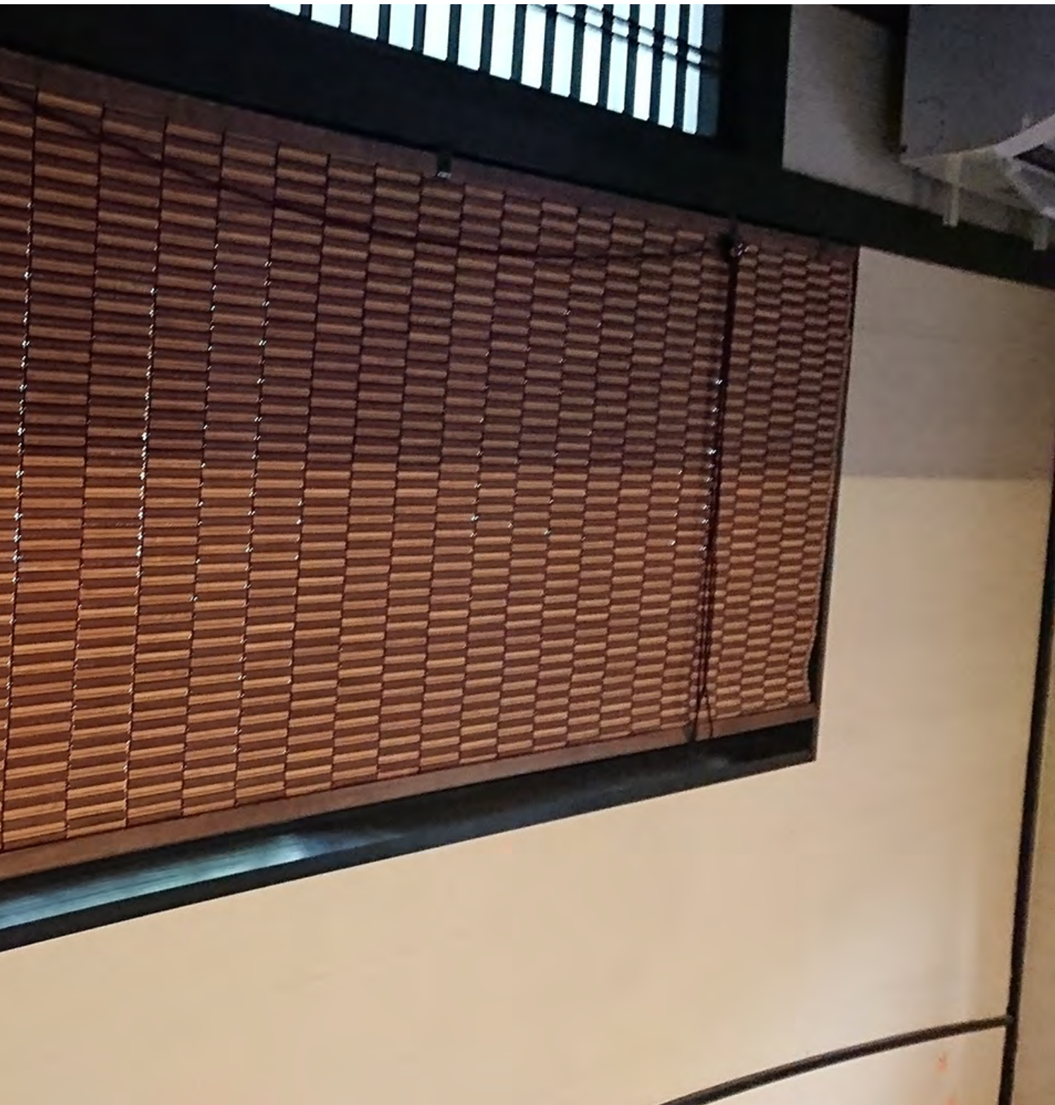
いぶしヒゴ（平ヒゴ+丸ヒゴ）波襞加工（遮熱生地：茶色）/2連巻上器付き