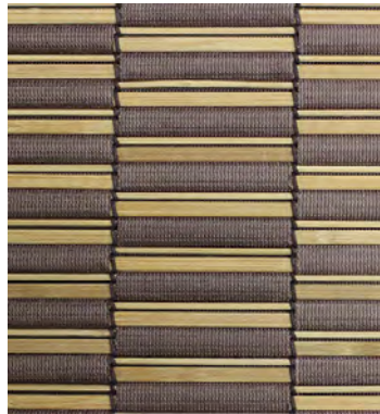
② 茶色 (遮熱生地)