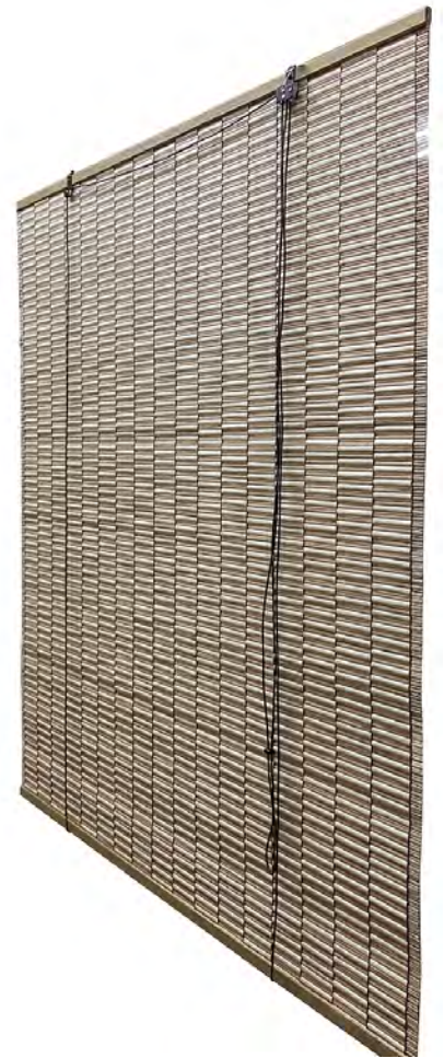
オーダーサイズ 波襜すだれ（遮熱生地：ベージュ使用）