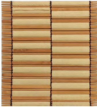
① ベージュ色 (遮熱生地)